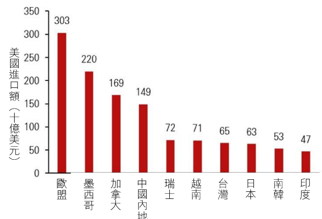
圖 2：兩大經濟體之間的貿易協定預計將帶來穩定